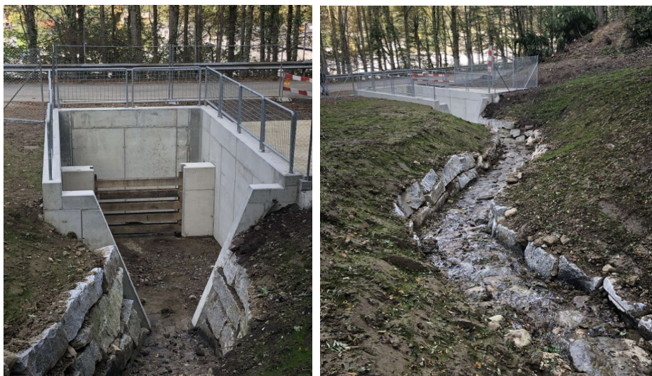
Fig. 4: Camera di ritenzione no 72

I lavori per l'esecuzione della nuova camera di ritenzione sono stati portati a termine nel 2023. Il collaudo formale dell'opera è avvenuto il 13 dicembre 2023. Attualmente, è in corso la liquidazione finale delle opere e la procedura per l'incasso del sussidio cantonale e federale e della quota parte a carico della città di Lugano.