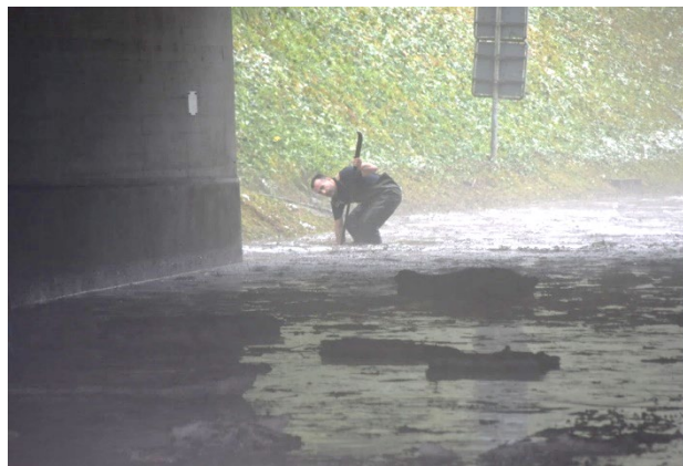
Fig. 2: Sottopasso Grancia

Il Consorzio è stato molto sollecitato per assicurare la vuotatura delle camere di ritenzione e la messa in atto di una serie di interventi di messa in sicurezza. Nei giorni successivi gli eventi, si è provveduto a rilevare, quantificare i danni alle infrastrutture e poi, si è proceduto all'esecuzione dei lavori di ripristino.