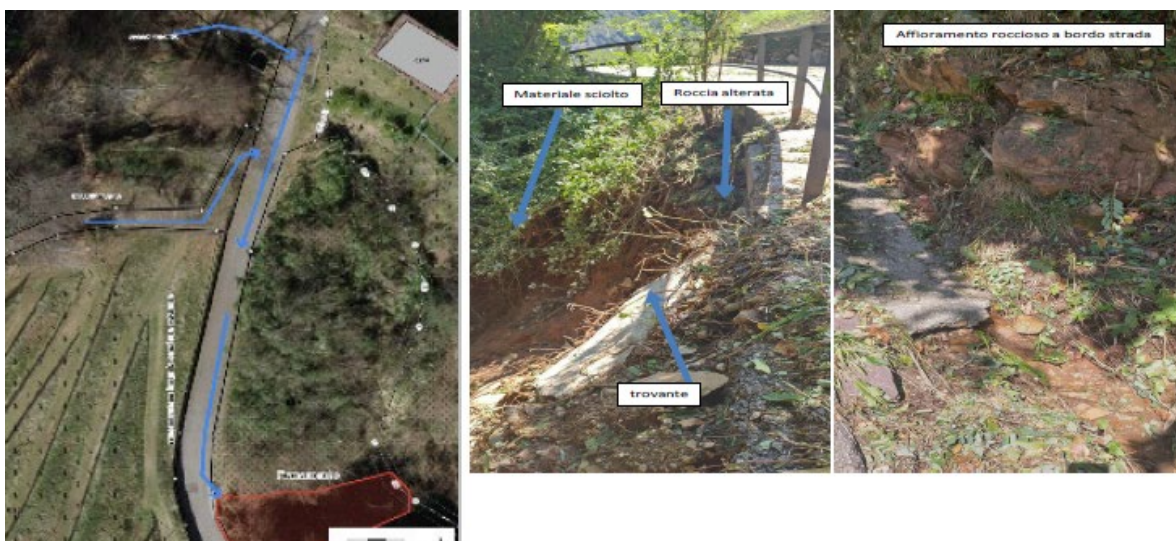
Fig. 3: Via Mattorino, Agra - franamento

A seguito delle forti piogge, le acque di ruscellamento provenienti, in parte, dalla camera di ritenzione n. 91 e, in parte, dal sentiero d'accesso ai vigneti (mappali no. 529, 530 e 531), si sono verosimilmente incanalate per 35-38 metri lungo la canaletta che corre lungo la strada comunale (lato valle), per poi riversarsi nella valletta sottostante in corrispondenza della curva della strada comunale.