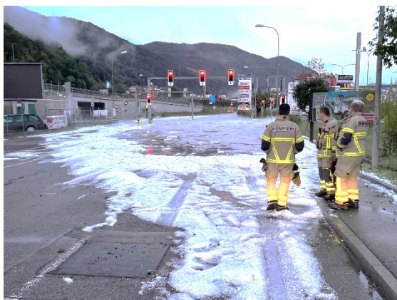
Fig. 1: Strada cantonale Pian Scairolo

Ciò, ha innescato localmente dei ruscellamenti e/o allagamenti superficiali, smottamenti, franamenti e rigurgiti delle tubazioni, causando danni a fondi pubblici e privati.